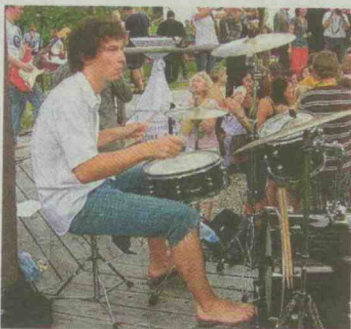
„Captain Kirks Flying Roller Coaster“ - die Raabser Band rockte vor Ort.