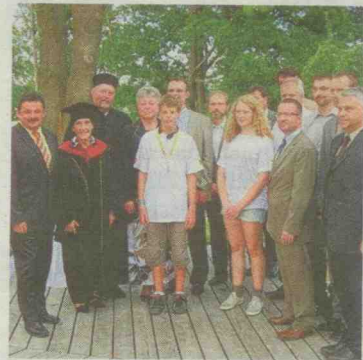
Ehrengäste und Studentenvertreter nach dem Festakt.