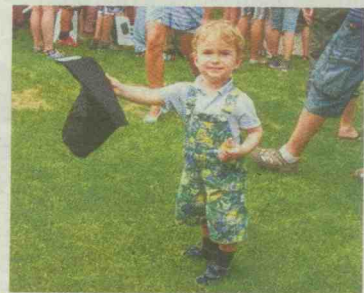
Die Zeit wird schnell vergehen, dann passt der Hut!