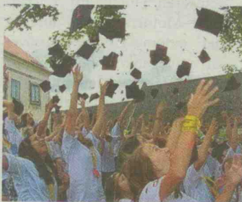
Nach dem Gelöbnis „Immer neugierig bleiben“ flogen die Studienhüte.

Wenn man sich Themen und Referentenliste anschaut, muss man sich als Erwachsener fragen, wo man Gelegenheit findet, eine Woche so geballte Horizonterweiterung zu erfahren. Der nunmehr bewährte Campus Raabs und das JUFA-Jugendgästehaus würden sich doch in gleicher Weise für Wissenswochen für Erwachsene anbieten und die Vortragenden hätten doppelte Herausforderung.