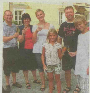
Mit Apfelsaft ließ sich gut mit den Eltern anstoßen.