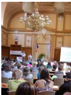
Die Junge Uni Waldviertel erkundete Jihlava/Iglau.

Spaß und Action gab es bei der Sportolympiade, rund um das Lagerfeuer und in der Uni-Disco.