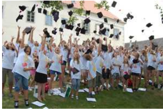
85 Jungstudierende feierten den Studienabschluss!

er die Jungstudierenden aus Österreich und Tschechien.